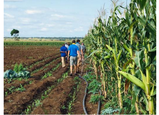
Een van die “tuine”.

HUL WELSTAND: Daar was meer reën gedurende die winter en die mense se tuine is pragtig danksy die Here se seën. Die mama’s sit langs die pad en verkoop die volop groente en vrugte.